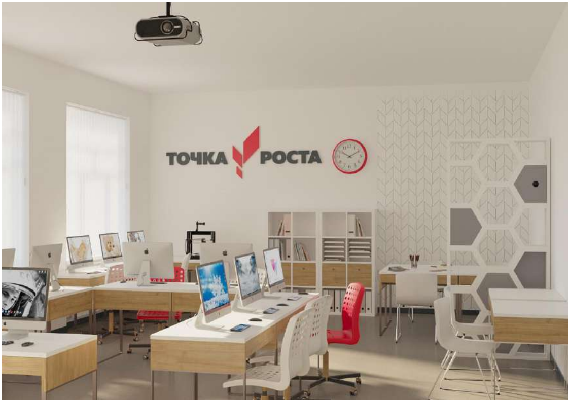
2. Коворкинг, шахматная гостиная, медиазона